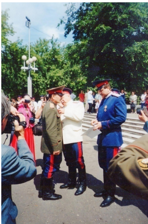
Достойная награда атаману Сибирского КВ