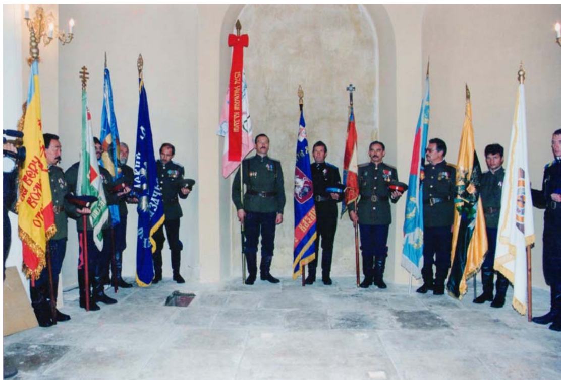
Знамена казачьих войск Союза казаков России, представленные на праздновании 15-ой годовщины Общероссийской общественной организации «Союза казаков».