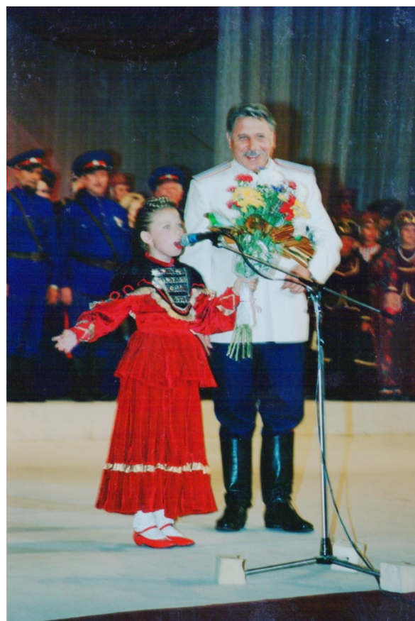
На бис поет казачка Луганской станицы