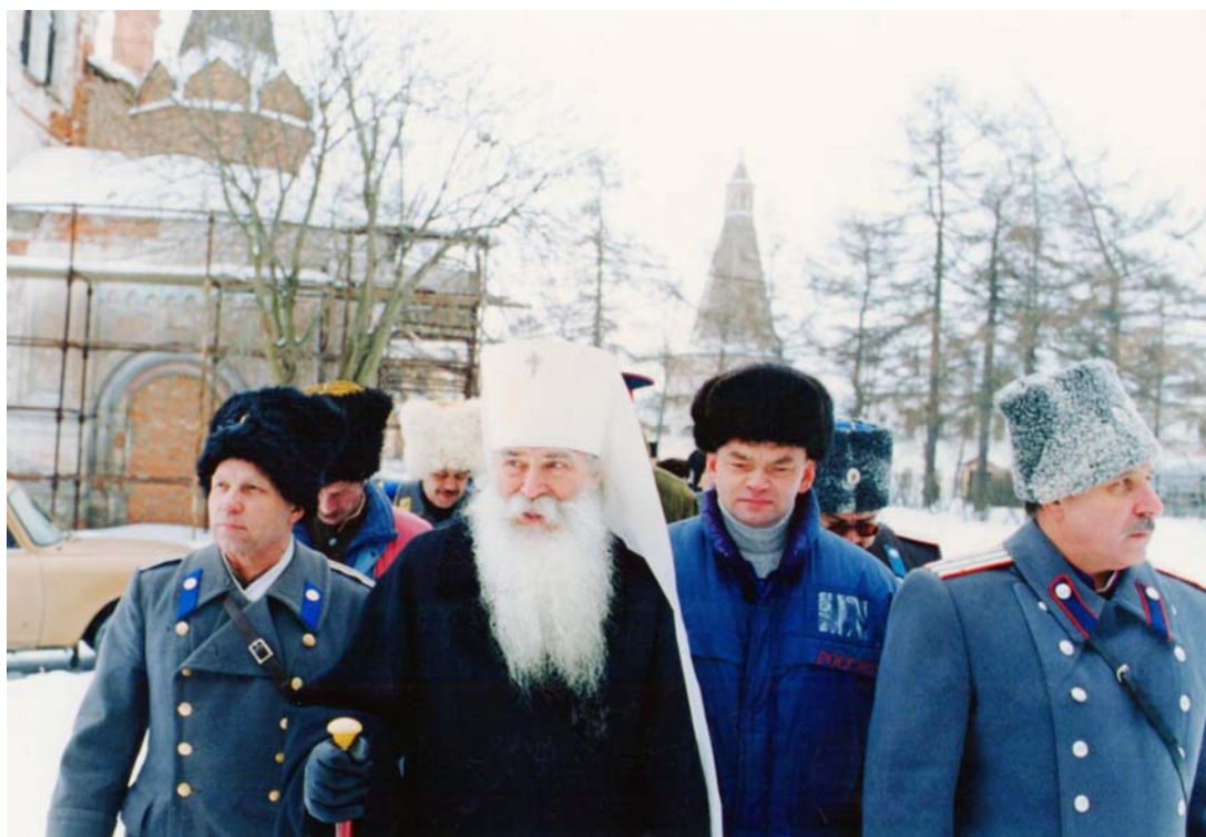
Совет атаманов Союза казаков России в гостях в Иосифо-Волоколамском монастыре у Владыки Питирима – Митрополита Волоколамского и Юрьевского, духовного наставника Казачества России.