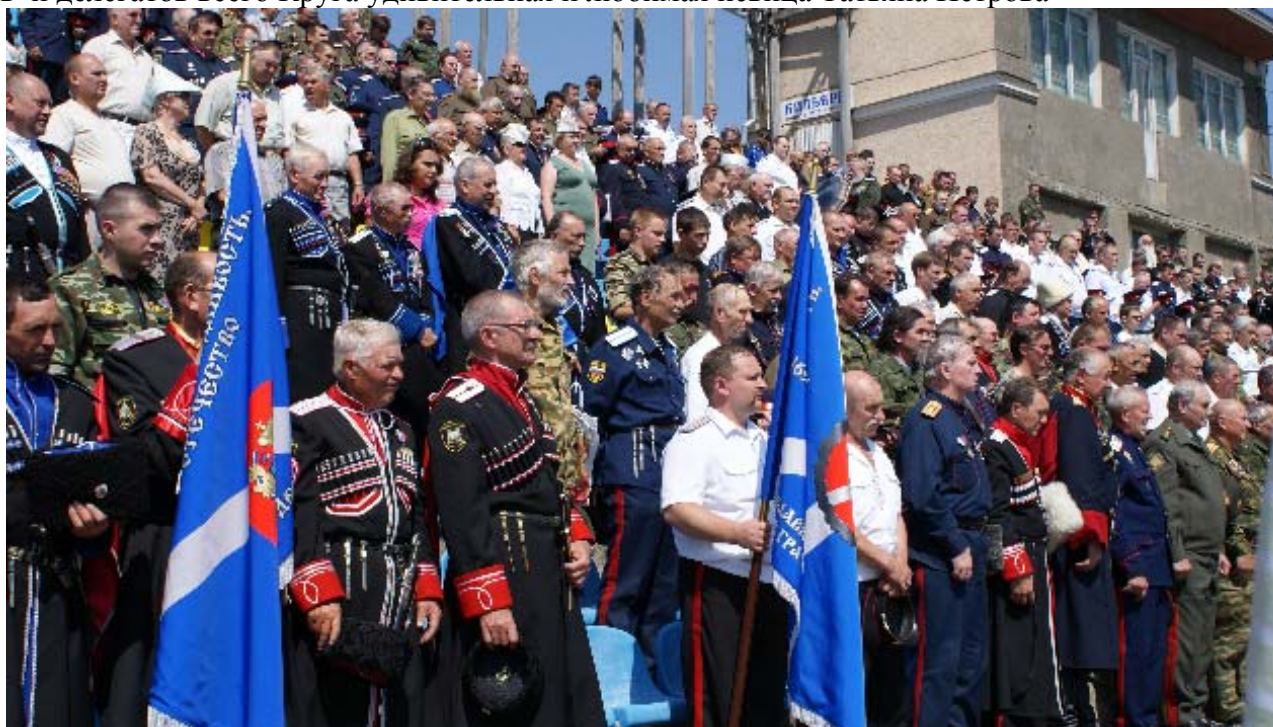
Седьмой Большой Круг Общероссийской общественной организации «Союза казаков» в г. Ставрополе 29 июня 2008 года стоя слушает православную молитву священника Русской Православной Церкви.