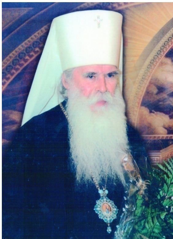
Высокопреосвященнейший Митрополит Волоколамский и Юрьевский Питирим ( К.В.Нечаев 08.01.1926- 04.11.2003 гг.)

Служба Богу и данной Им Родине, народу православному. Пожалуй, именно в этом состояло земное бытие Митрополита Волоколамского и Юрьевского Питирима – иерарха, обладавшего глубочайшей церковной культурой.